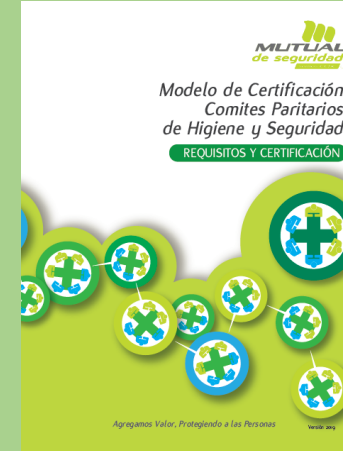
Manual de Certificación

Apoyar el mejoramiento continuo y asegurar el cumplimiento de los Decretos Supremos N° 54/69 y N° 76/06.